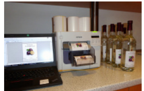
Der Epson ColorWorks C3500 produziert bei der Brennerei Preiser schnell und kostengünstig Etiketten.