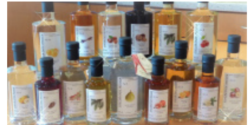
Individuelle Etiketten verleihen jedem Produkt Wertigkeit